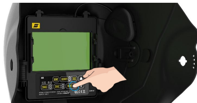
ADF vysoké optické třídy, s barevným dotykovým displejem