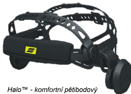
Halo™ - komfortní pětibodový hlavový kříž (pohled zepředu)